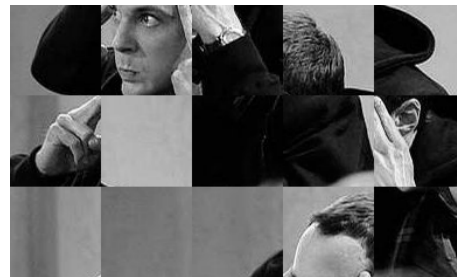
(b) Immagine di output ( 390 \times 234 )

Si completi nel file mosaic/mosaic.c la funzione mosaic con il seguente prototipo: