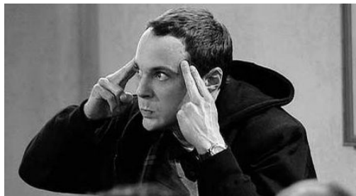
(a) Immagine di input ( 445 \times 243 )

Lo scopo dell'esercizio è quello di scrivere un modulo C basato su OpenCL che, dati in input un'immagine a 256 toni di grigio di dimensione w \times h e il lato di una mattonella quadrata, crei una nuova immagine in cui le mattonelle quadrate in cui viene decomposta l'immagine di input vengano ricomposte in ordine casuale a formare un puzzle a mosaico. L'esempio seguente è ottenuto con mattonelle 78 \times 78 :